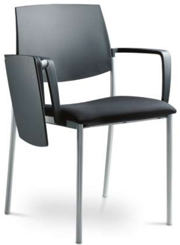
190-K-B + TP ■