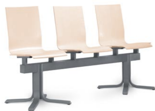
220/3 ■ • 3místná lavice. Bukový korpus a lakovaná ocelová podnož. • 3-seat bench. Beech shell and powder-coated steel base. • Bank mit 3 Plätzen. Buchenkorpus und lackiertes Stahlgestell.