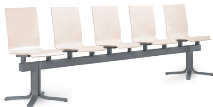
220/5 ■ • 5místná lavice. Bukový korpus a lakovaná ocelová podnož. • 5-seat bench. Beech shell and powder-coated steel base. • Bank mit 5 Plätzen. Buchenkorpus und lackiertes Stahlgestell.