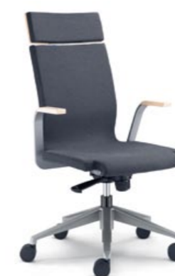
223 ■ • Čalouněná kancelářská židle. Dřevěné područky a lakovaný hliníkový kříž. • Upholstered office chair. Wooden armrests and powder-coated aluminium five-star base. • Gepolsterter Bürostuhl. Armlehnen aus Holz und lackiertes Aluminiumkreuz.