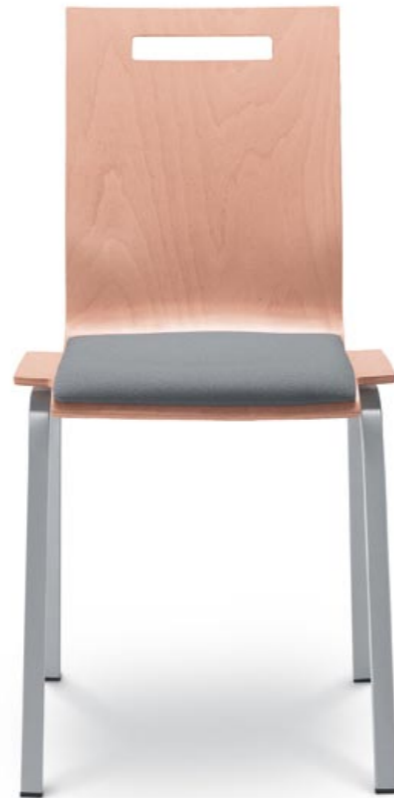
220-0 ■ + PS

Stahl und Edelholz, also ein subtiles Stahlprofil und Formstücke aus Buchenholz, sind der grundlegende Baustein der Modelle 220 und 221, bei denen diese Kombination einen Eindruck von vollkommener Leichtigkeit evoziert. In Wirklichkeit sind die Stühle sehr fest, einfach hand-habbar und stapelbar. Sie können auch mit eingebauten Verbindungen für das Verbinden der Stühle zu Reihen ausgerüstet werden.