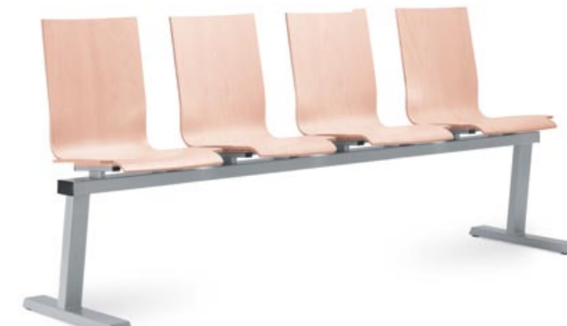
221/4 ■ • 4místná lavice. Bukový korpus a lakovaná ocelová podnož. • 4-seat bench. Beech shell and powder-coated steel base. • Bank mit 4 Plätzen. Buchenkorpus und lackiertes Stahlgestell.