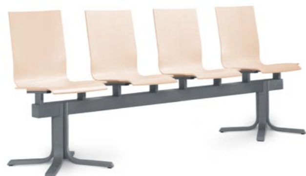
220/4 ■ • 4místná lavice. Bukový korpus a lakovaná ocelová podnož. • 4-seat bench. Beech shell and powder-coated steel base. • Bank mit 4 Plätzen. Buchenkorpus und lackiertes Stahlgestell.