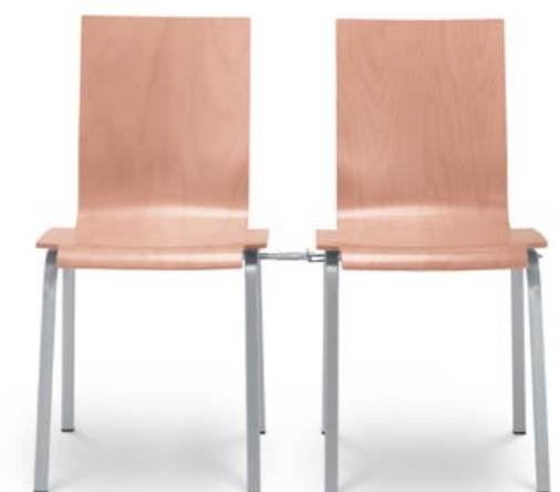
220 ■ + SR