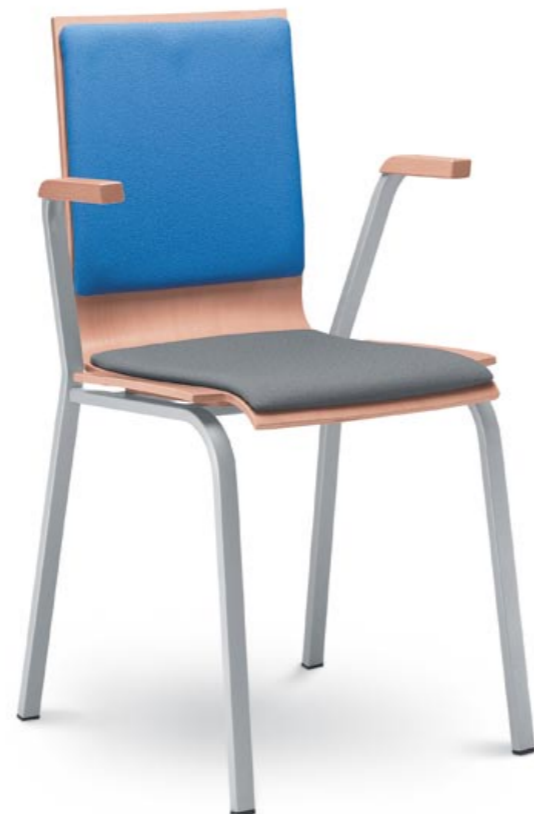
221 ■ + PS/PO