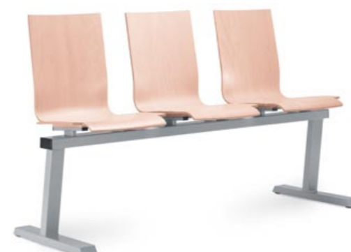
221/3 ■ • 3místná lavice. Bukový korpus a lakovaná ocelová podnož. • 3-seat bench. Beech shell and powder-coated steel base. • Bank mit 3 Plätzen. Buchenkorpus und lackiertes Stahlgestell.