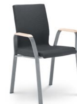
224 ■ • Konferenční křeslo celočalouněné. Dřevěné područky a lakovaná ocelová podnož. • Conference chair, fully upholstered. Wooden armrests and powder-coated steel base. • Vollgepolsterter Konferenzsessel. Armlehnen aus Holz und lackiertes Stahlgestell.