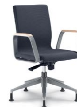
222 ■ • Konferenční křeslo celočalouněné. Dřevěné područky a lakovaná ocelová podnož. • Conference armchair, fully upholstered. Wooden armrests and powder-coated aluminium five-star base. • Vollgepolsterter Konferenzsessel. Armlehnen aus Holz und lackiertes Aluminiumkreuz.