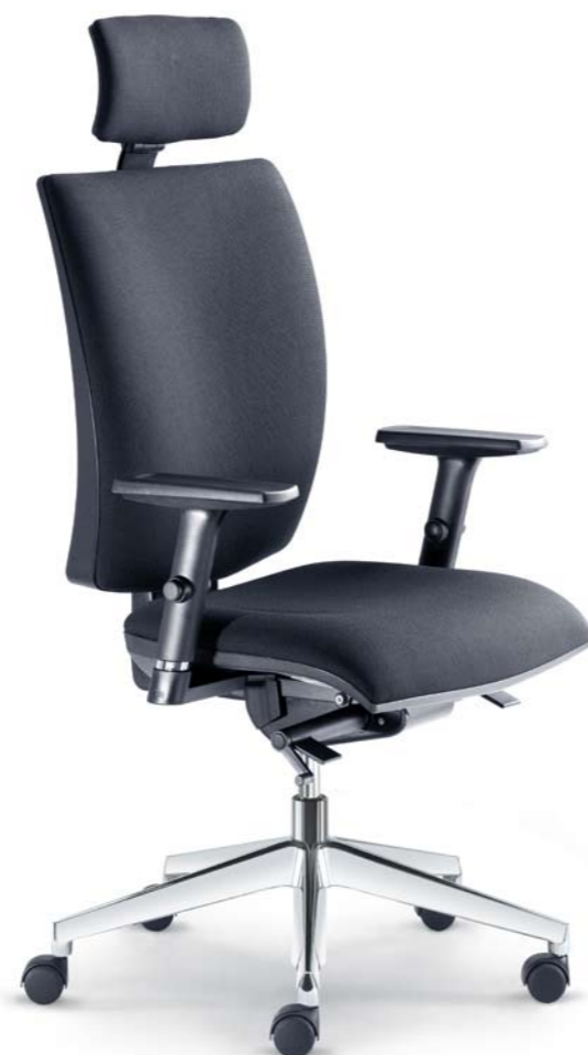
237-SYS + BR-236

Die Serie Lyra ist so entworfen, dass sie alle Anforderungen des Benutzers erfüllt und dabei ein anziehendes und frisches Design hat. Was die technischen Parameter des Stuhls anbelangt, ist er mit vielen Funktionen ausgestattet, die man nur bei Stühlen der höheren Kategorie findet. Das Funktionszentrum des Stuhls ist der Synchronmechanismus, der zusammen mit der höheninstellbaren Rückenlehne eventuel Kopfstütze und den höheninstellbaren Armlehnen die richtige Sitzergonomie für jeden Benutzer sicherstellt.