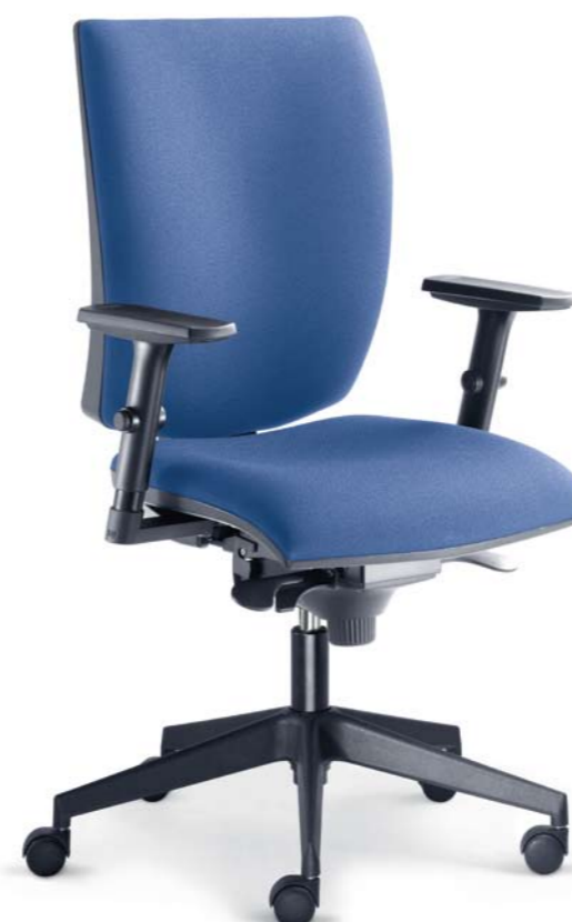
235-SY + BR-236