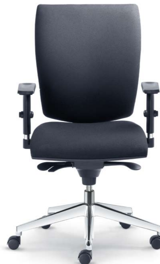
235-SY + BR-236

Was die Ergonomie des Sitzens anbelangt, ist der Synchronmechanismus die günstigste Wahl. Zu den Funktionen, die in ihn einkomponiert sind, gehören die Einstellung der Sitzhöhe, die individuelle Einstellung des Mechanismus gemäß dem Gewicht des Benutzers, 5 Positionen der Winkelblockierung der Rückenlehne oder die unblockierte Synchronbewegung der Rückenlehne und des Sitzes.