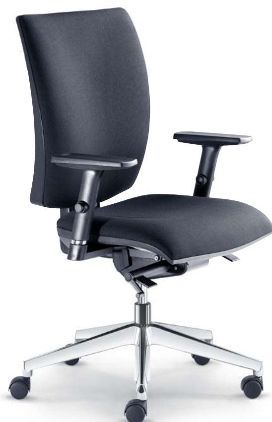
235-SYS + BR-236

Co se týká ergonomie sezení, nejpříznivější volbou je synchronní mechanismus. Mezi funkce, které jsou do něho zakomponované, patří nastavení výšky sedáku, individuální nastavení mechanismu dle hmotnosti uživatele, 5 pozic blokace úhlu opěradla nebo neblokovaný plynulý synchronní pohyb opěradla a sedadla.