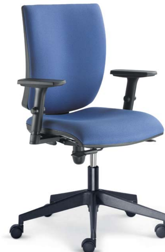
232-CPL + BR-236