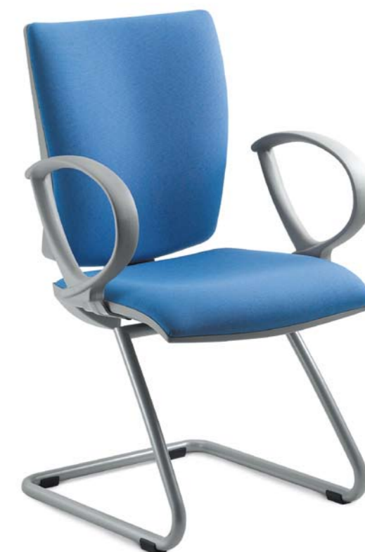
231-KZ + BR-231