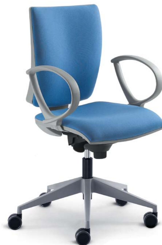
231-SY + BR-231

Die hellgrauen Kunststoff- und Verkleidungsteile dieses formschönen Bürostuhles sind eine echte Design-Alternative, passend zu modernen Einrichtungstrends.