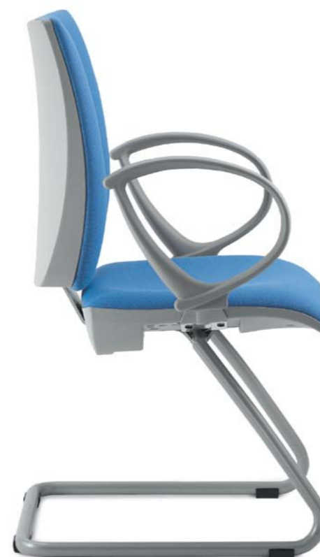
231-KZ + BR-231

Das Stuhlkreuz bietet wählbare Varianten, und zwar zwischen einer aus Aluminium und einer aus Nylon gefertigten Version, die ein übereinstimmendes Design haben.