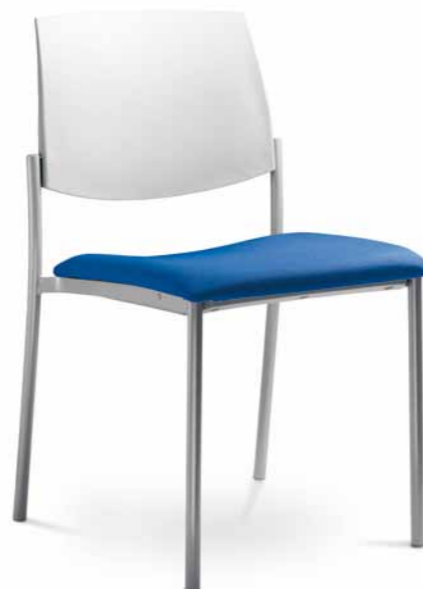
SEANCE ART 180-K ■