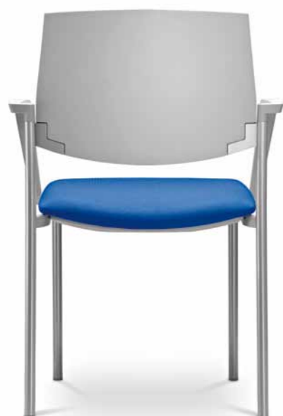
SEANCE ART 180-K-B ■