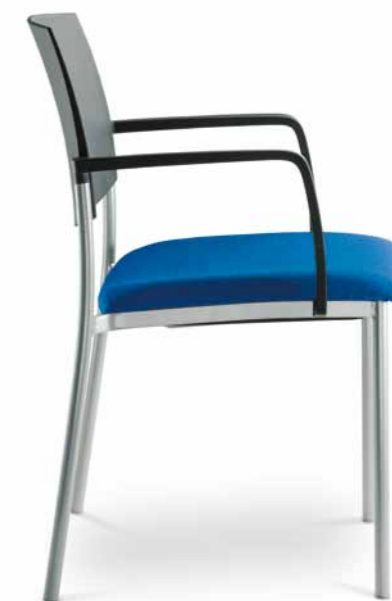
SEANCE ART 190-K-B ■