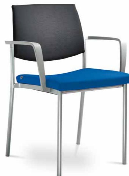
SEANCE ART 181-K-B ■