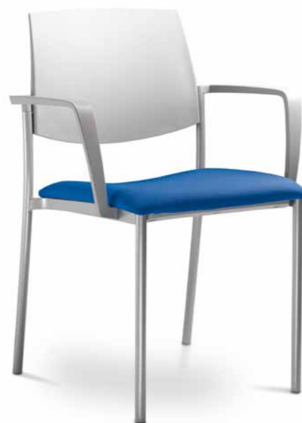
SEANCE ART 180-K-B ■